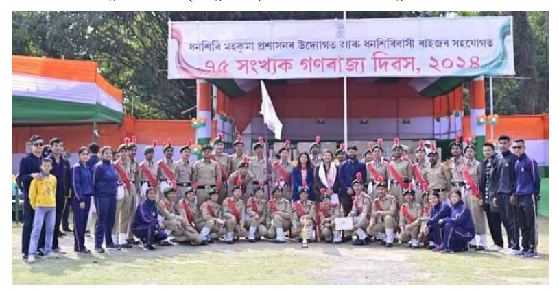
ধনশিৰি মহকুমাই আয়োজন কৰা ৭৫ সংখ্যক গণৰাজ্য দিৱসত অংশগ্ৰহণ কৰা সৰুপথাৰ মহাবিদ্যালয়ৰ দল