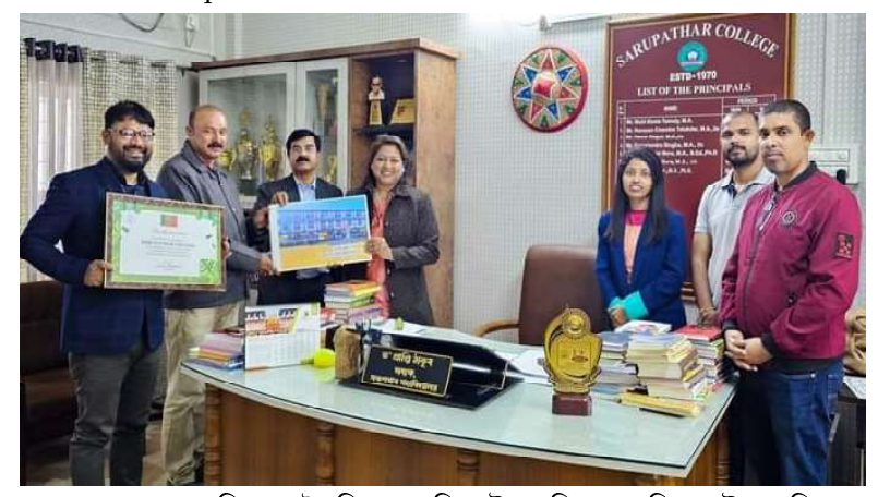
অসম চৰকাৰৰ বন বিভাগৰ হৈ জিলা বন বিষয়াই মহাবিদ্যালয়খনিত সেউজ পৰিৱেশ বৰ্তাই ৰখাৰ বাবে প্ৰশংসা পত্ৰ প্ৰদান কৰাৰ বিশেষ মুহূৰ্ত