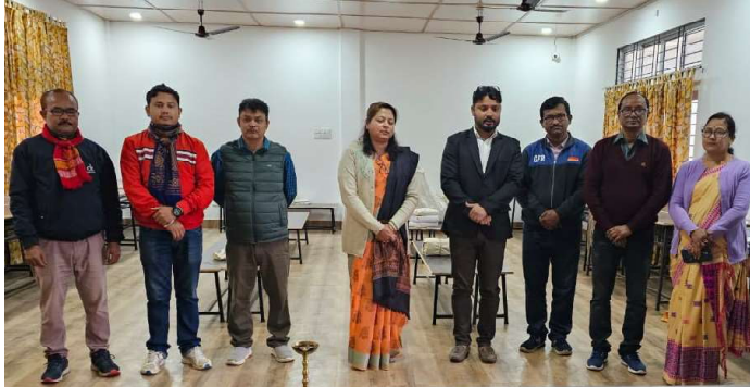
অসম উচ্চতৰ মাধ্যমিক শিক্ষা সংসদৰ উচ্চতৰ মাধ্যমিক চুড়ান্ত পৰীক্ষাৰ সৰুপথাৰ মহাবিদ্যালয় মাণ্ডলিক মূল্যায়ন কেন্দ্ৰ আৰম্ভণিৰ এক বিশেষ মুহূৰ্তত