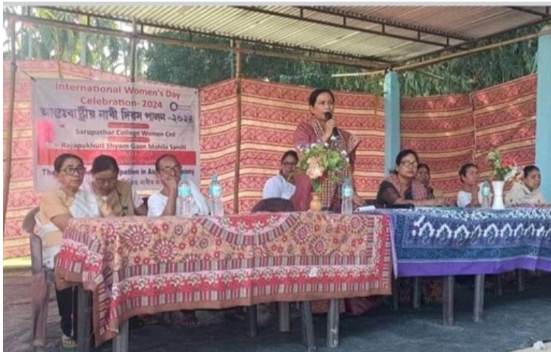
International Women's Day celebration at Rajapukhuri Shyam Gaon