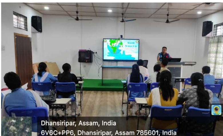
Dhansiripar, Assam, India 6V6C+PP6, Dhansiripar, Assam 785601, India World Water day organized by Day Observation Cell.