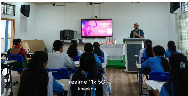
Sarupathar College honours the Legacy of Bodofa Upendra Nath Brahma on Chaatra Divas