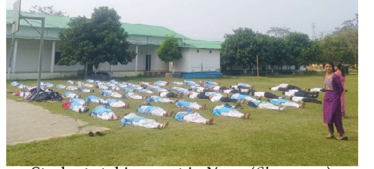
Students taking part in Yoga (Shavasana)