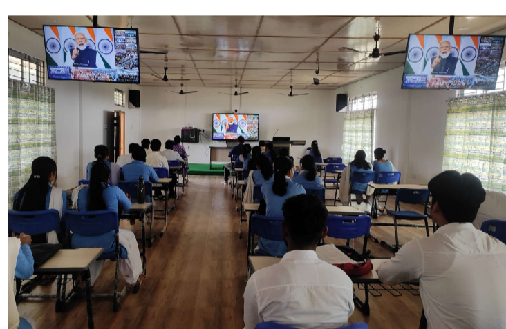
Students' watching live telecast of foundation stone laying ceremony of semi-conductor project at Jagiroad