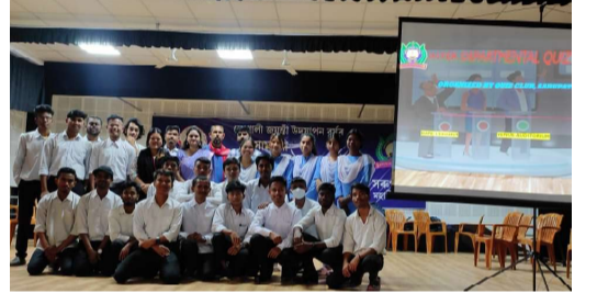
Inter departmental quiz competition