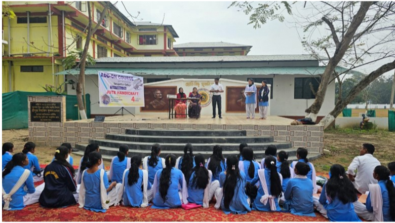
Add-on Course on Jute Handicraft (Hadicraft Practice in India) by Department of Sociology