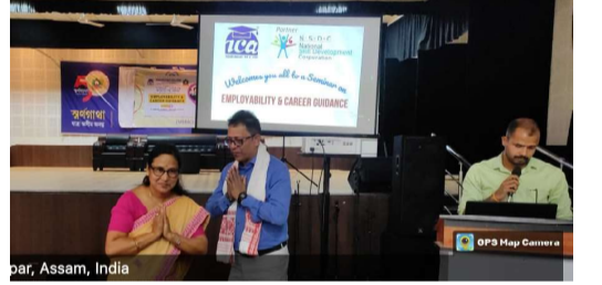
Seminar on "Employability and Career Guidance"