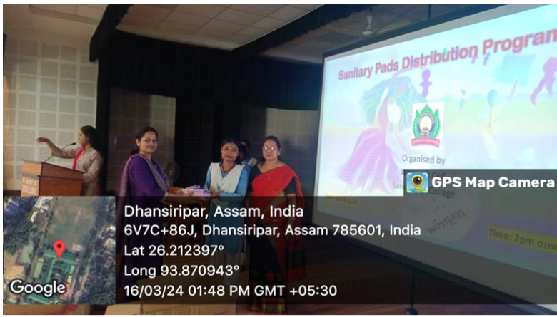
Dhansiripar, Assam, India 6V7C+86J, Dhansiripar, Assam 785601, India Lat 26.212397° Long 93.870943° 16/03/24 01:48 PM GMT +05:30 Women Cell of Sarupathar College while distributing sanitary napkins to the girls on 16 th March,2023