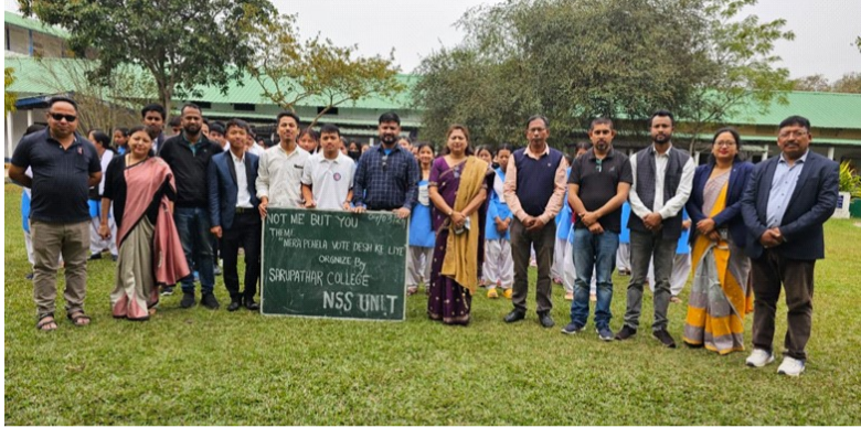
Voting Awareness Campaign by NSS Unit, Sarupathar College on 4 th March,2024