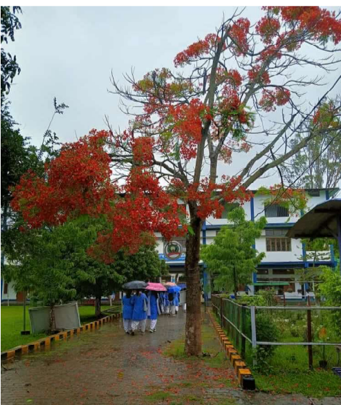
মহাবিদ্যালয়ৰ বাকৰিত বৰ্ষাসিক্ত এটি দুপৰীয়া