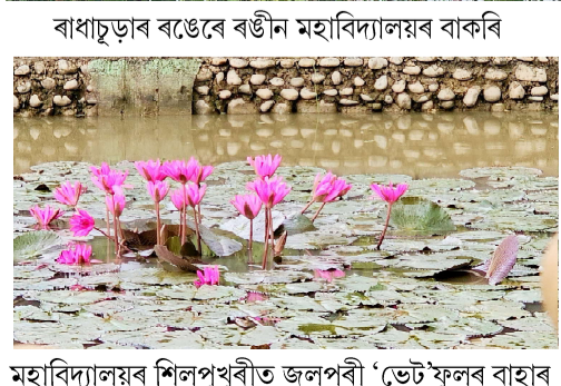
মহাবিদ্যালয়ৰ শিলপুখুৰীত জলপৰী 'ভেট'ফুলৰ বাহাৰ