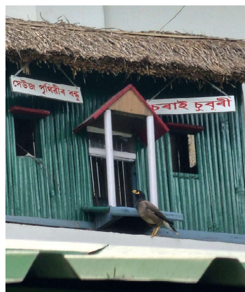
মহাবিদ্যালয়ৰ 'চৰাই চুবুৰী'ত নতুন আলহী

৬-৭-২০২৪তাৰিখ, জুলাই মাহৰ প্ৰথমটো শনিবাৰে ধনশিৰি মহকুমা চিকিৎসা কেন্দ্ৰৰ সহযোগত ৰজাপুখুৰী শ্যাম গাঁৱত বিনামূলীয়া স্বাস্থ্য শিবিৰ