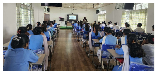
Interactive Session on NEP 2020

২৯ অক্টোবৰ, ২০২৪ তাৰিখৰ পৰা বোকাখাতৰ জেডিএছজি মহাবিদ্যালয়ত আৰম্ভ হোৱা ডিব্ৰুগড় বিশ্ববিদ্যালয়ৰ আন্তঃমহাবিদ্যালয় ফুটবল (পুৰুষ) প্ৰতিযোগিতাত সৰুপথাৰ মহাবিদ্যালয়ৰ দলটিয়ে গোলাঘাট মণ্ডলৰ চেম্পিয়ন খিতাপ অৰ্জন কৰিবলৈ সক্ষম হয়।