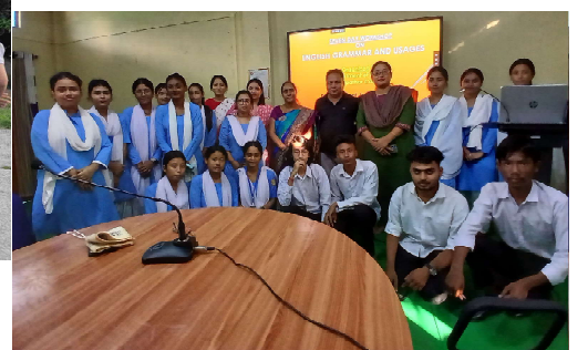
English "Department's Workshop on English Grammar and Usages conducted from 30 th September to 7 th October, 2024