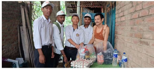
NSS unit of sarupathar college, donated necessary household items