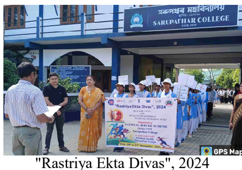
"Rastriya Ekta Divas", 2024

An interactive session on "Brain Cognition for Career Development and Life Skills" was organised on 24 th October, 2024 in Sarupathar College Digital Conference Hall where Resource Persons from the Assam down town University, Guwahati took part. A large number of students from Arts and Commerce streams along with several faculty members of the college attended the programme.■