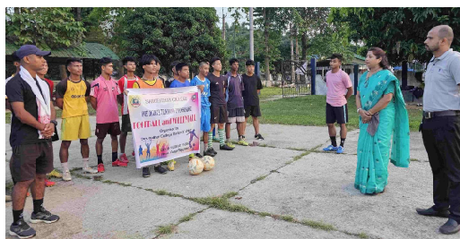
One month Training Programme for Football and Volleyball