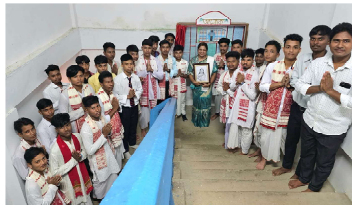
Bir Chilarai Chatra Nivas, Sarupathar College inaugurates its first Wall Magazine ALUK on 7 th October, 2024