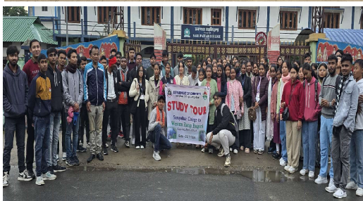
Commerce Department's Study Tour to Kaziranga National Park