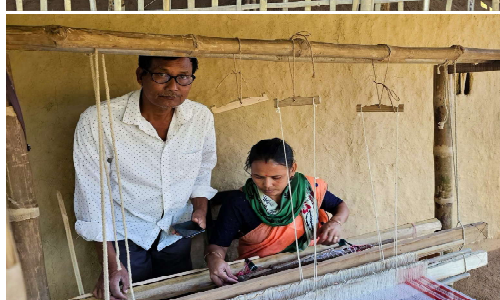
সৰুপথাৰ মহাবিদ্যালয়ৰ তাঁতশালত গামোচা