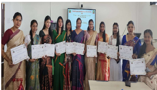
সৌন্দৰ্য চৰ্চা পাঠ্যক্ৰমৰ প্ৰমাণ-পত্ৰ প্ৰদান

‘সামাজিক সমন্বয় সাধনত শংকৰদেৱৰ ভক্তিমৰ্ম আন্দোলন আৰু দৰ্শন’ বিষয়ক দুদিনীয়া কাৰ্যসূচীৰে এখনি আলোচনা চক্ৰখন অনুষ্ঠিত হয়।