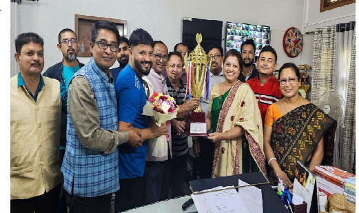
মাণ্ডলিক পৰ্যায়ৰ ভলীবল প্ৰতিযোগিতাত সৰুপথাৰ মহাবিদ্যালয় ২০২৪ বৰ্ষৰ চেম্পিয়ন।