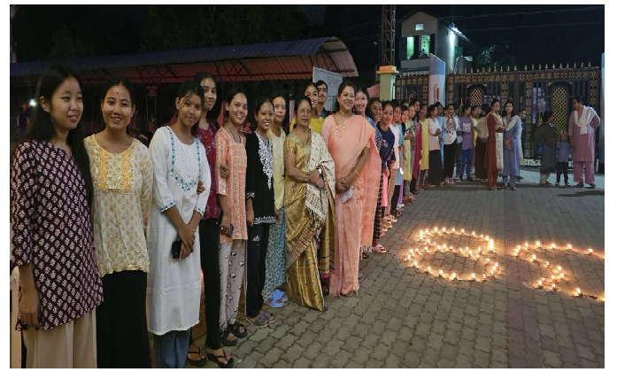
সৰুপথাৰ মহাবিদ্যালয়ৰ ৫৪ সংখ্যক প্ৰতিষ্ঠা দিৱস উদযাপন